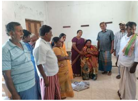
ధన్యవాదాలు తెలియజేశారు. తాము మాజీ ఎమ్మెల్యే కిలివేటి సంజీవయ్య వెంట ఎప్పుడు కలిసి పని చేస్తామని సూచించారు. ఇనుగుంట గ్రామంలో ప్రజలు తమ కుటుంబానికి ఎంపీటీసీ సభ్యులుగాను, సర్పంచ్ గారు ఎంపిక చేసుకున్నందుకు మరో మారు కృతజ్ఞతలు తెలియజేశారు.