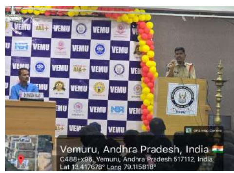
అవగాహన కార్యక్రమాల విద్యార్థుల్లో క్రమశిక్షణను పెంపొందించడంలో కీలక పాత్ర పోషిస్తాయని తెలిపారు. కాలేజీ తరపున భవిష్యత్లో కూడా ఇటువంటి సామాజిక అవగాహన కార్యక్రమాలను నిరంతరం నిర్వహిస్తామని హామీ ఇచ్చారు.