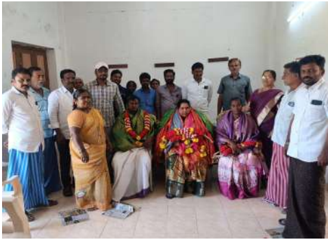
నిజాయితీతో పని చేశారని తెలియజేశారు. పంచాయితీ అభివృద్ధిలో త్రాగు నీటికి, సిని రోడ్డు, డ్రైనేజీ కాలువలు, పైప్ లైన్లు వంటి అభివృద్ధి కార్యక్రమాల కి నిద్ర మంజూరు చేసి తన వంతు సహాయ సహకారాలు పంచాయితీకి అందించాలని గుర్తు చేశారు.